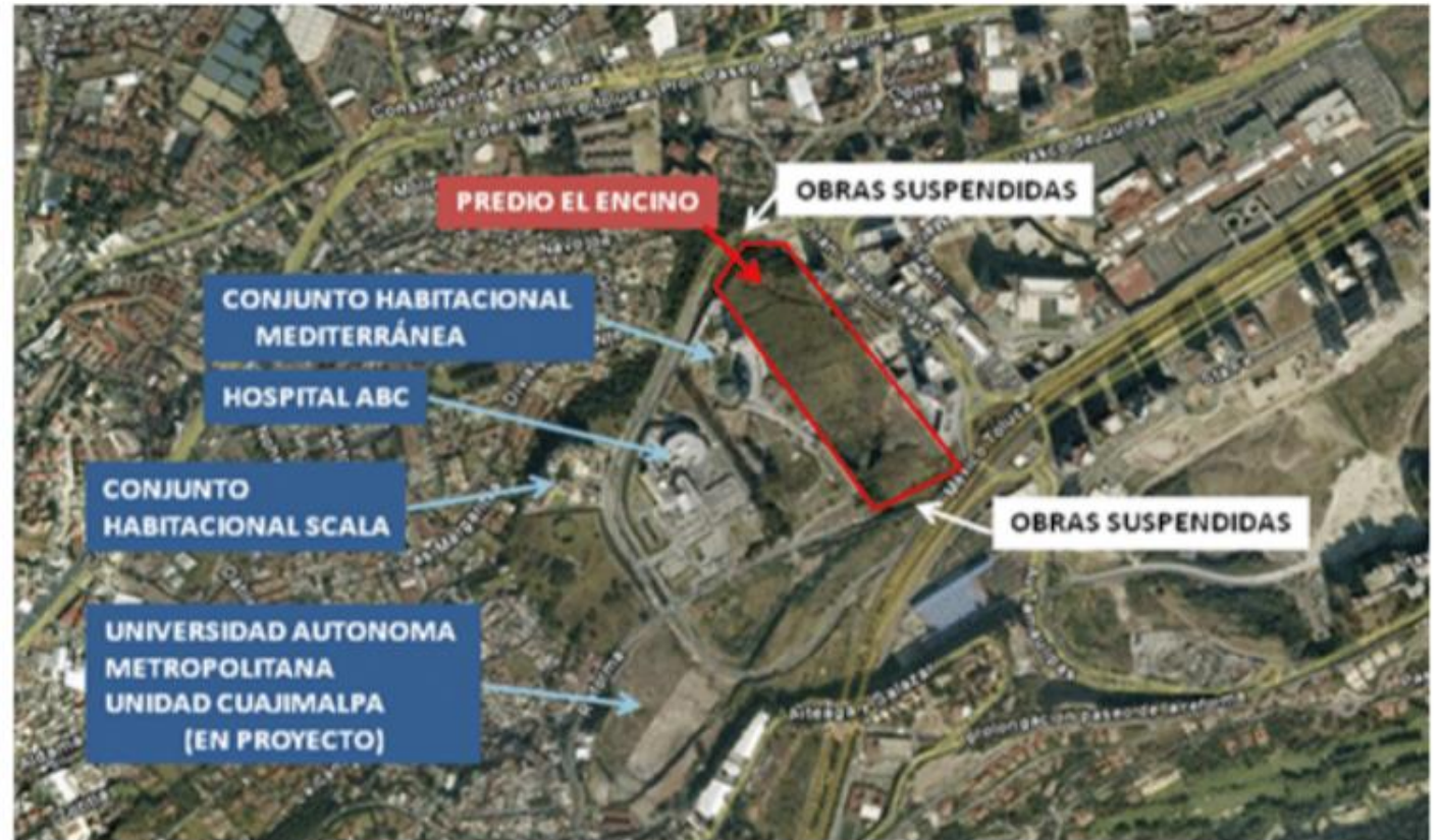
Mapa. III.1 Localización de las obras viales proyectadas en el predio El Encino.